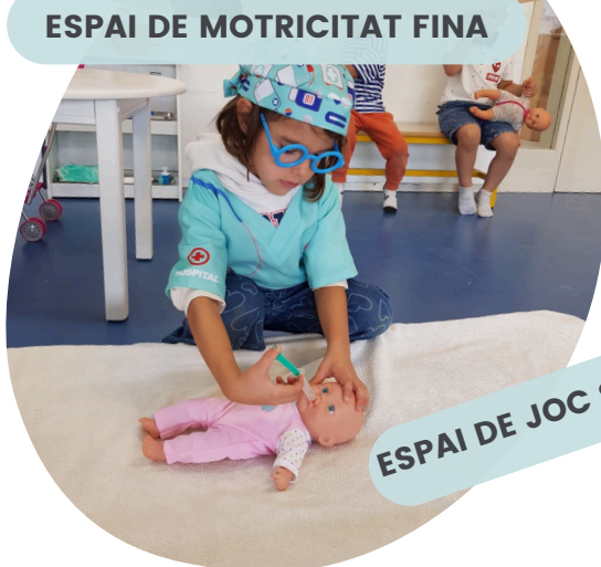
ESPAI DE JOC SIMBÒLIC