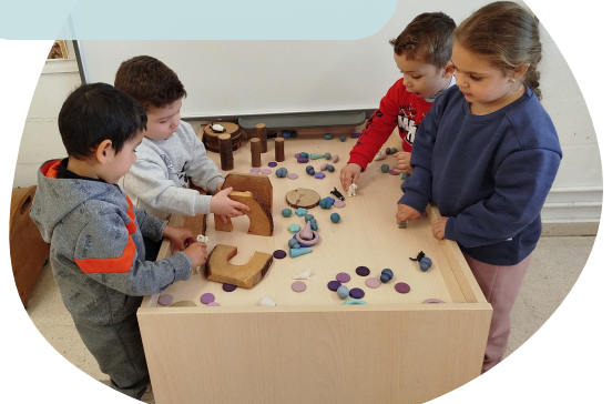
ESPAI DE MINIMONS